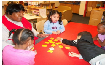
Niños involucrados en el juego dirigido

varias décadas y son refinados continuamente basado en la última investigación en la